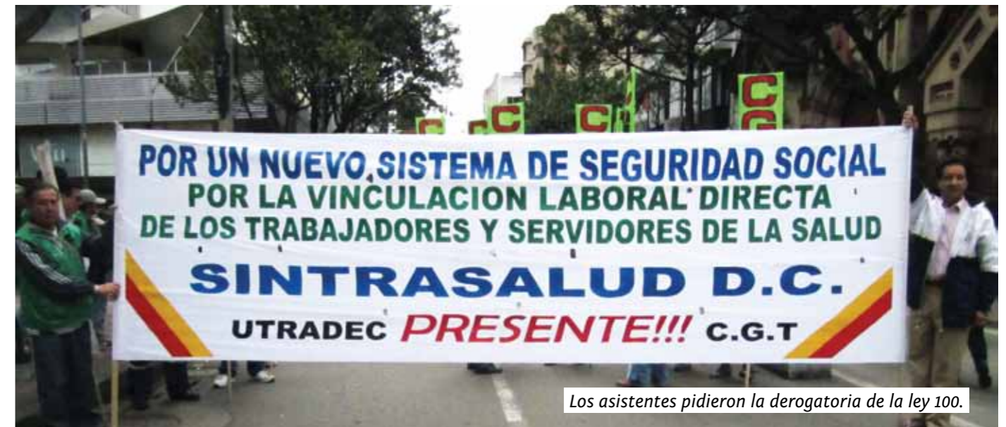
Los asistentes pidieron la derogatoria de la ley 100.