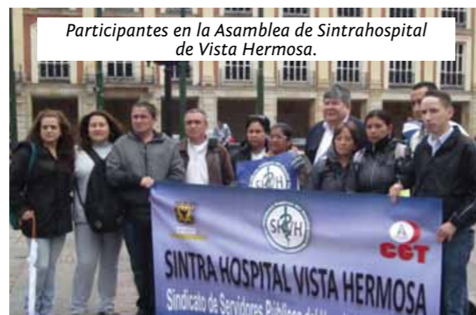
Participantes en la Asamblea de Sintrahospital de Vista Hermosa.