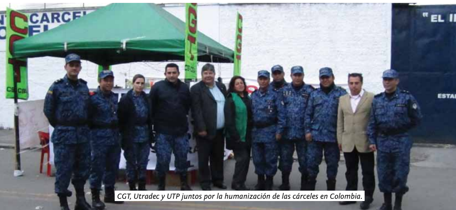
CGT, Utradec y UTP juntos por la humanización de las cárceles en Colombia.