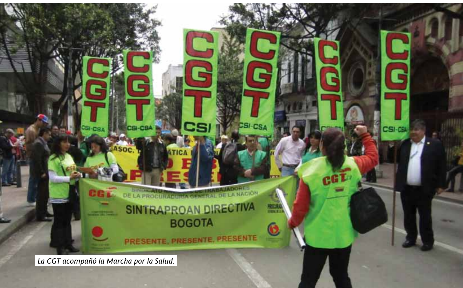
La CGT acompañó la Marcha por la Salud.