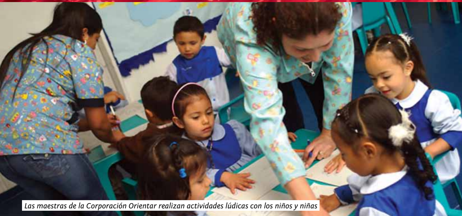
Las maestras de la Corporación Orientar realizan actividades lúdicas con los niños y niñas

lar a padres, madres y/o cuidadores de los niños y niñas que conozcan los principios básicos de la salud y la alimentación de la infancia y las ventajas de la lactancia materna, la higiene y el saneamiento ambiental, el derecho a la alimentación así como el derecho al agua, son derechos fundamentales de toda persona inalienables, y exigibles.