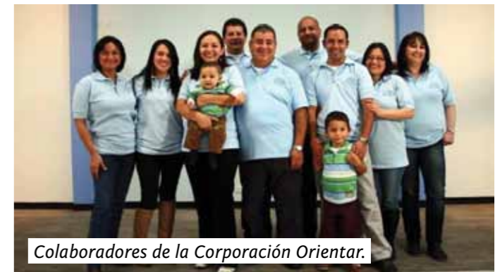
Colaboradores de la Corporación Orientar.

De acuerdo al estudio y a la observación de las maestras durante los dos últimos años de atención, los niños y las niñas se presentan como sujetos con infinitas capacidades, y potencialidades tanto cognitivas, corporales, artísticas y sociales.