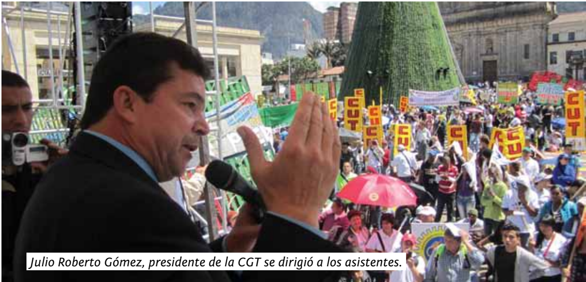
Julio Roberto Gómez, presidente de la CGT se dirigió a los asistentes.

El pasado 30 de octubre se llevó a cabo con éxito la marcha organizada por los trabajadores, estudiantes y organizaciones sindicales para protestar por el anunciado desmonte de los impuestos parafiscales a través de la Reforma Tributaria presentada por el gobierno nacional.