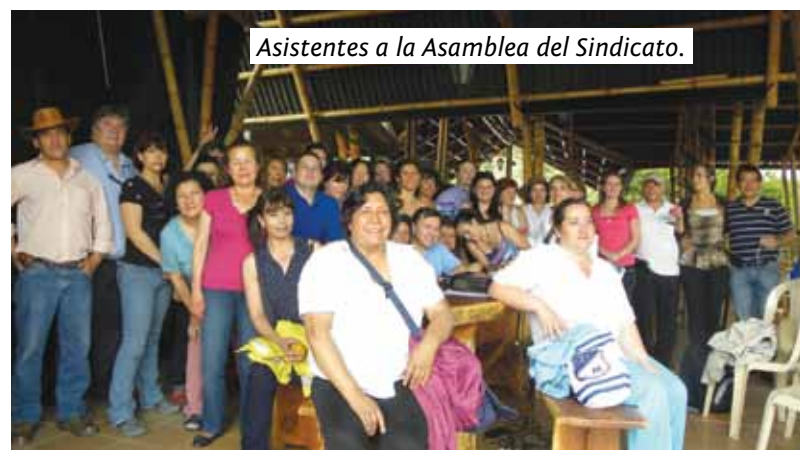
Asistentes a la Asamblea del Sindicato.

El pasado 24 de noviembre, en La Mesa (Cundinamarca) se reunió la Asamblea del Sindicato de Trabajadores del Hospital de Tunjuelito, donde se presentó un informe de las actividades desarrolladas en el último año, así como sobre las finanzas de la organización sindical. Del mismo modo, eligió tres nuevos dirigentes sindicales para proveer vacantes de la Junta Directiva.