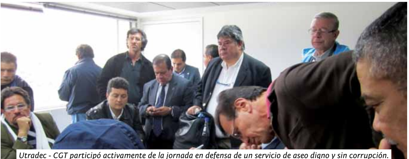
Utradec - CGT participó activamente de la jornada en defensa de un servicio de aseo digno y sin corrupción.