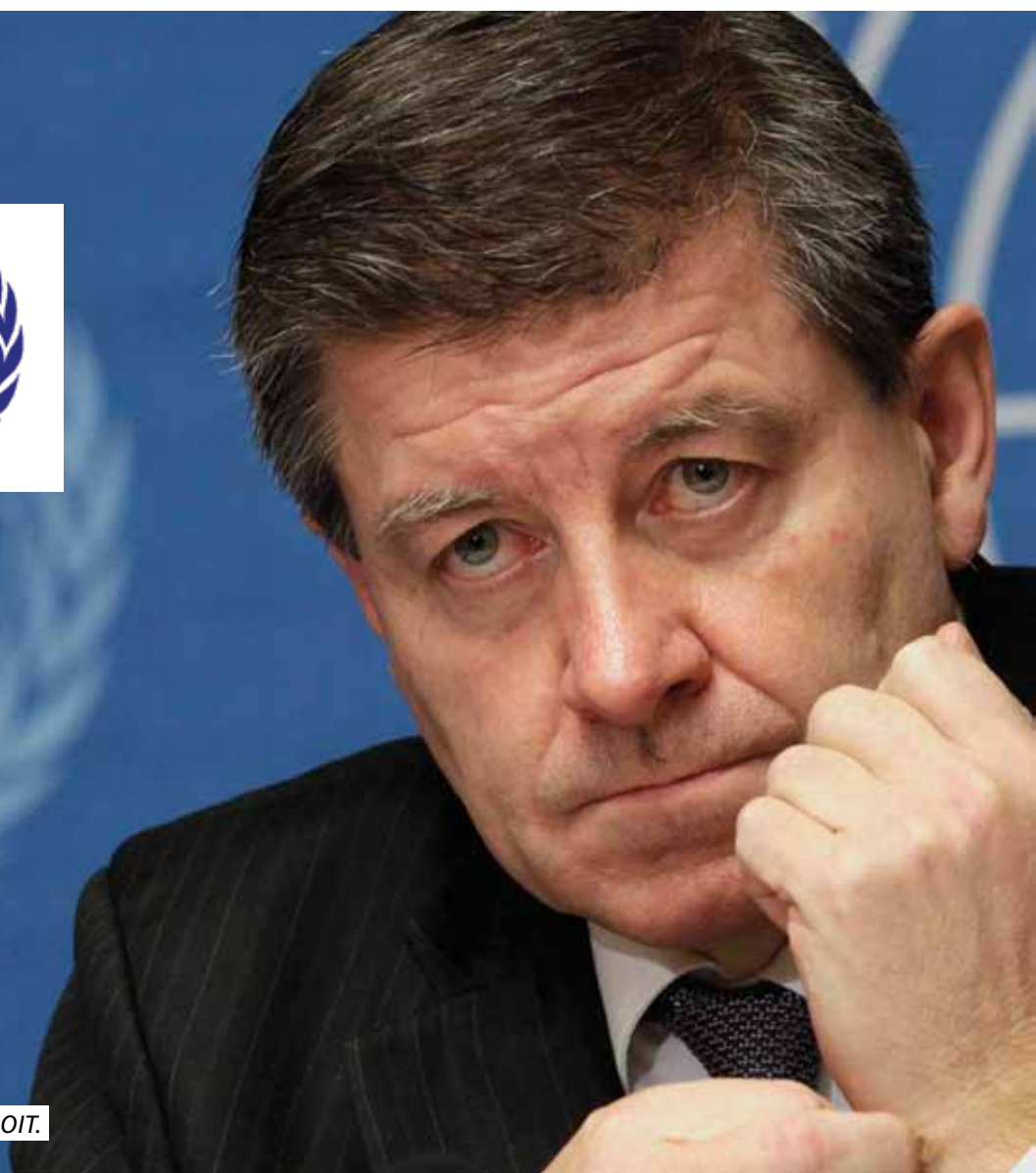
Guy Ryder, presidente de la OIT.