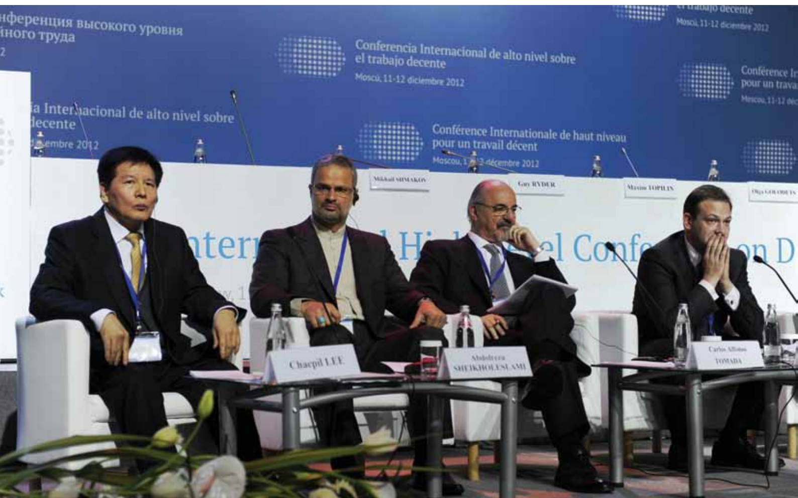
Unos 900 delegados provenientes de más de 80 países participaron de la conferencia organizada por el Gobierno de Rusia en cooperación con la OIT.