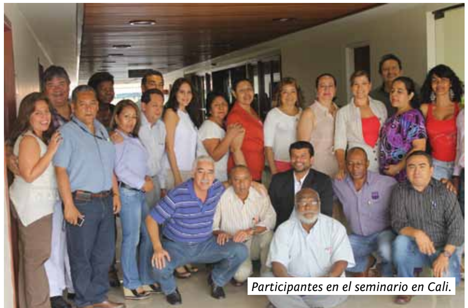
Participantes en el seminario en Cali.

El objetivo era alcanzar la formación integral en los conocimientos que en buena hora deben tener los afiliados activos de Sintepumcali.