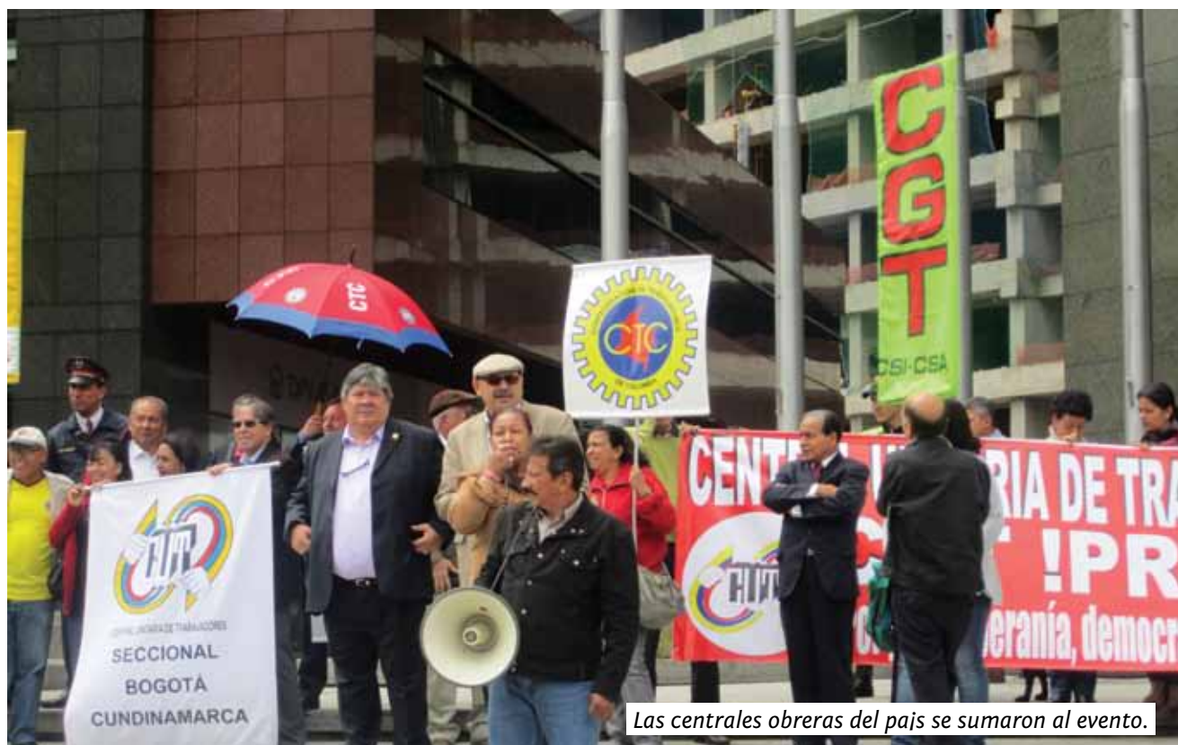
Las centrales obreras del país se sumaron al evento.