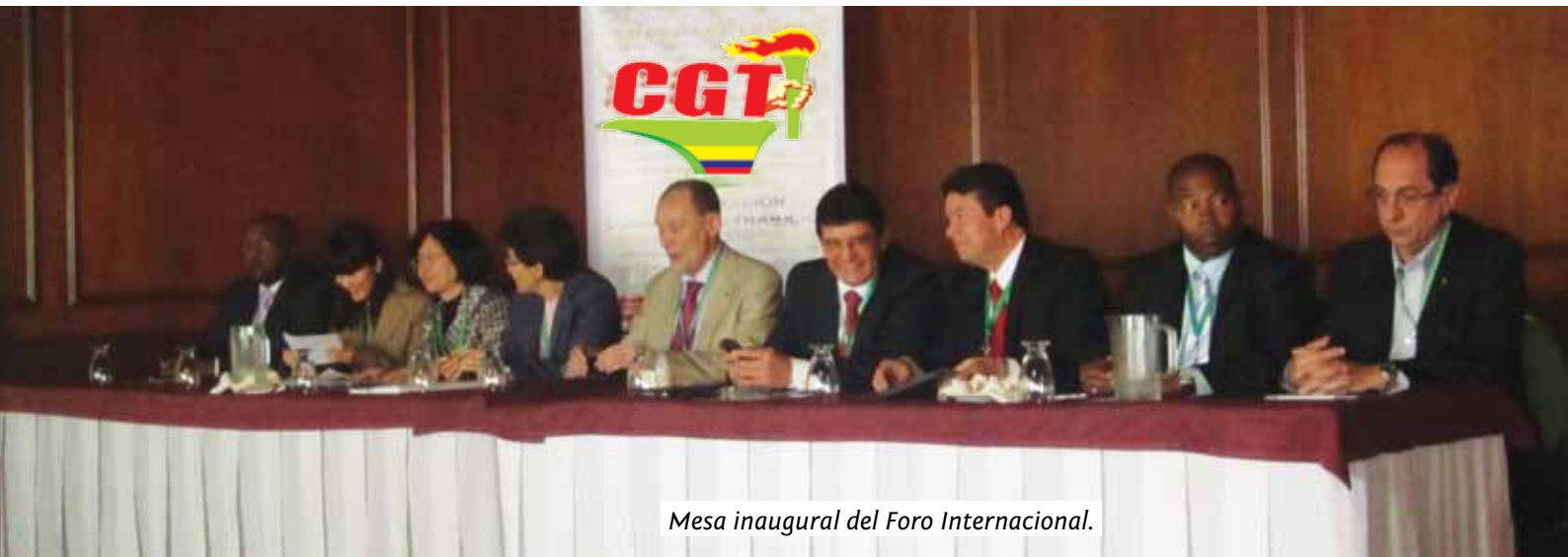
Mesa inaugural del Foro Internacional.