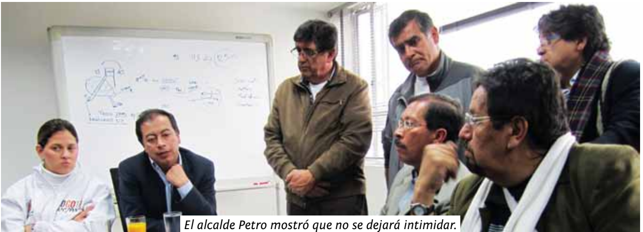
El alcalde Petro mostró que no se dejará intimidar.