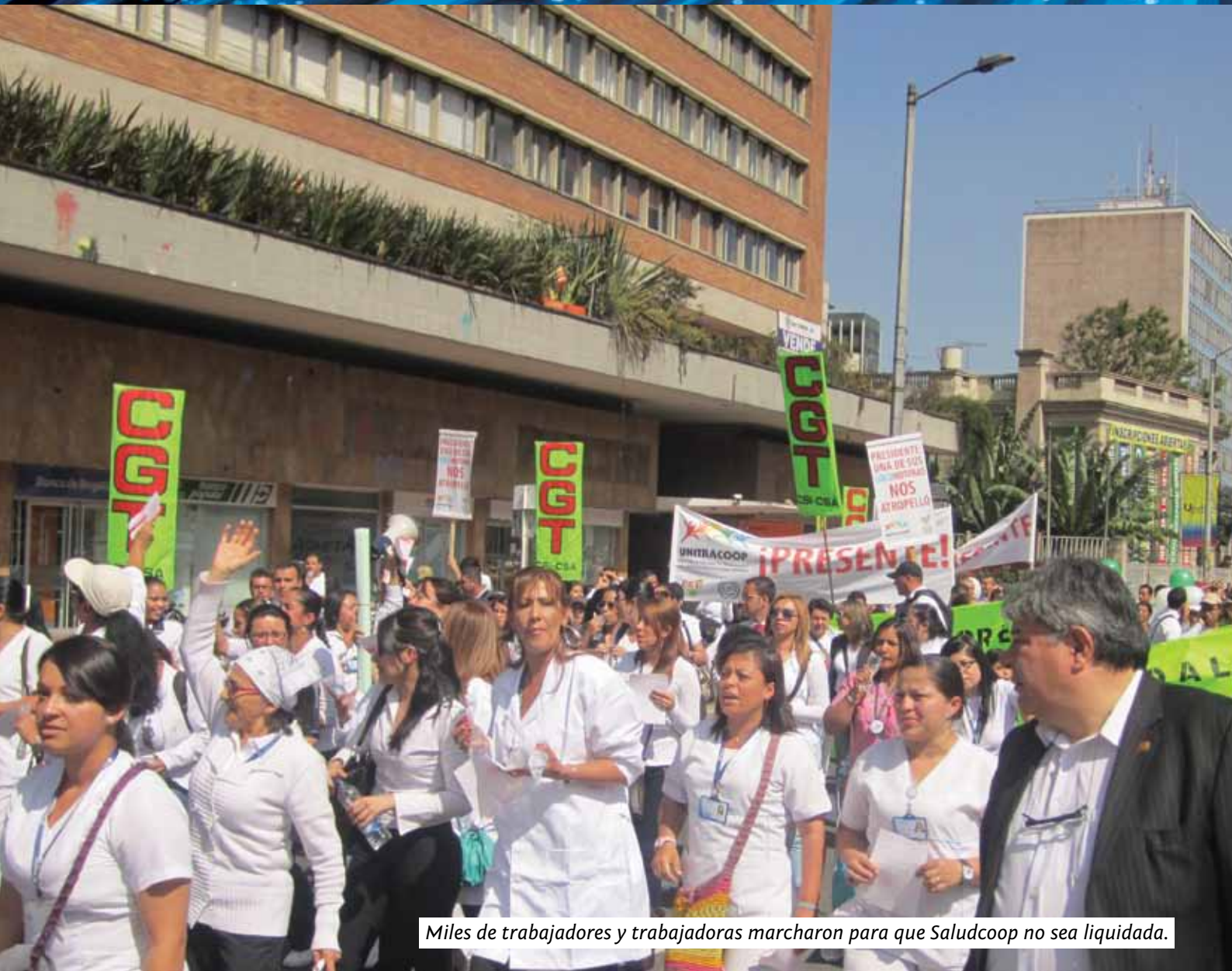
Miles de trabajadores y trabajadoras marcharon para que Saludcoop no sea liquidada.