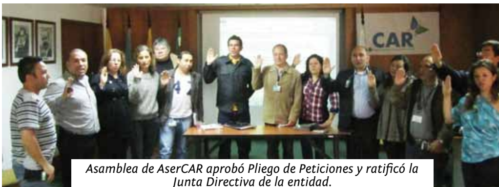
Asamblea de AserCAR aprobó Pliego de Peticiones y ratificó la Junta Directiva de la entidad.