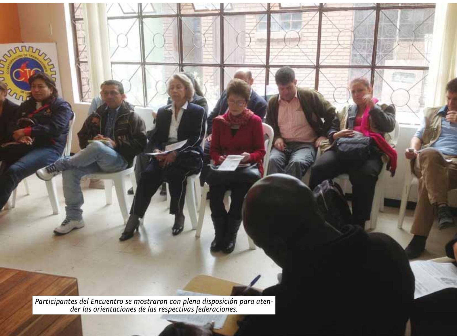
Participantes del Encuentro se mostraron con plena disposición para atender las orientaciones de las respectivas federaciones.

CIÓN COLECTIVA EN LA ADMINISTRACIÓN PÚBLICA, UN CAMINO A SEGUIR” señala que se hace prioritaria la promoción del derecho de Negociación Colectiva entre los empleados al servicio del Estado y los gobiernos nacionales, independiente de la ratificación de los convenios 151 y 154 de la OIT. La Comisión de expertos dice “además de examinar la información que contienen las memorias, la Comisión se ha esforzado por tomar en consideración la legislación y la práctica en la materia, y quiere hacer hincapié en la importancia capital que concede a la práctica, es decir, a la aplicación real de los convenios de la OIT ratificados, dado que una mera adecuación formal de las legislaciones nacionales con los convenios de