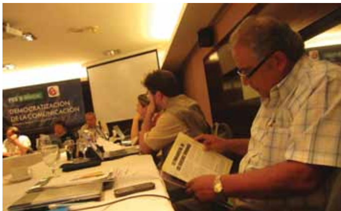
El evento permitió tener la mirada desde varios puntos geográficos del continente.