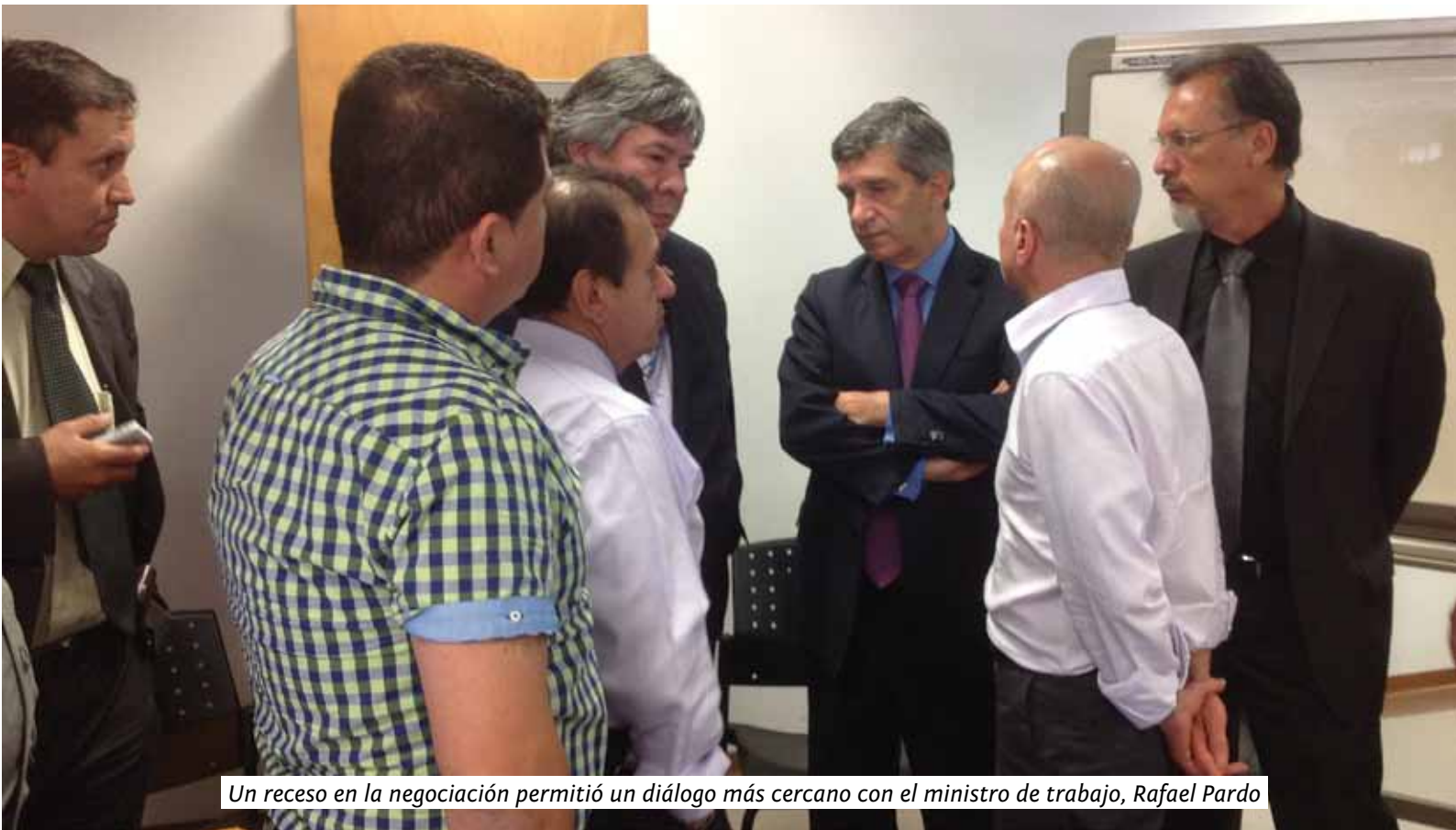
Un receso en la negociación permitió un diálogo más cercano con el ministro de trabajo, Rafael Pardo

Ríos Muñoz, precisó que “El Gobierno tiene una absoluta disposición para avanzar en esta negociación y haremos el mejor de los esfuerzos para que las partes salgan satisfechas”.