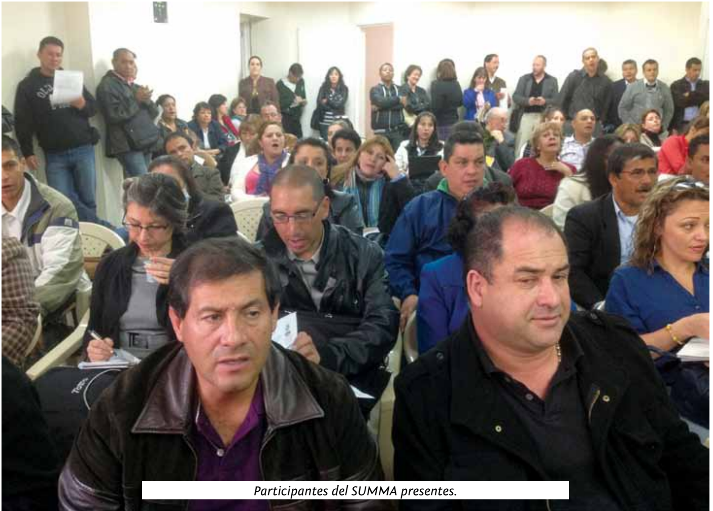
Participantes del SUMMA presentes.

la OIT sin una aplicación efectiva no tiene mucho sentido”