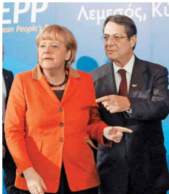
Ángela Merkel, canciller alemana y Nikos Anastasiadis, presidente de Chipre.