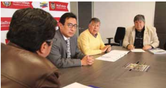
Momento previo a la firma del acta de inicio de la negociación.

M ediante la firma de un acta entre el Gobierno Nacional y delegados de la Confederación de empleados públicos, se oficializó el inicio de la negociación colectiva en el sector público.