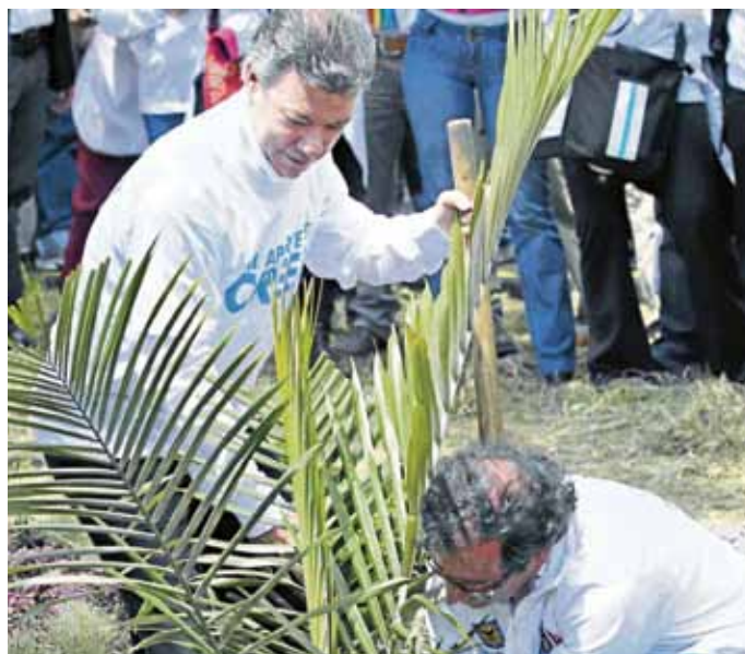
Petro ayudó a Santos en la tarea de la siembra. Un ejemplo de construcción de Paz.