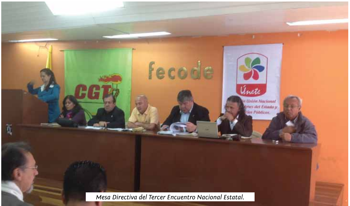
Mesa Directiva del Tercer Encuentro Nacional Estatal.