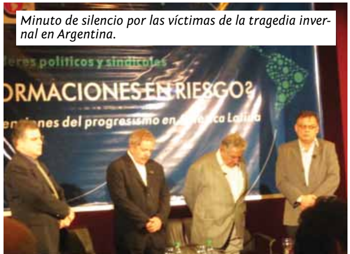
Minuto de silencio por las víctimas de la tragedia invernal en Argentina.