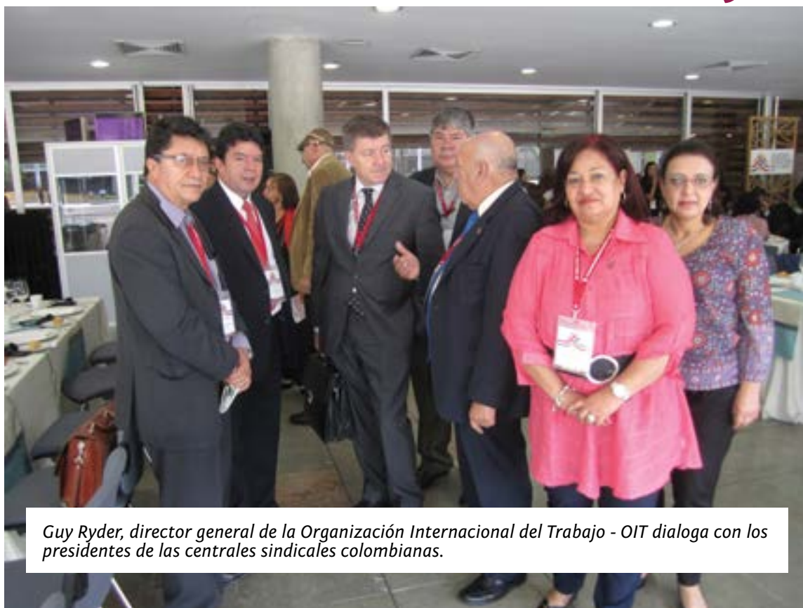
Guy Ryder, director general de la Organización Internacional del Trabajo - OIT dialoga con los presidentes de las centrales sindicales colombianas.

La Confederación Sindical de Trabajadores/as de las Américas (CSA) y el Consejo Sindical de Asesoramiento Técnico (COSATE) divulgan a continuación un fragmento del documento sindical presentado durante la XVIII Conferencia Interamericana de Ministros de Trabajo titulada “50 años de diálogo interamericano para la promoción de la justicia social en el Trabajo Decente: avances y desafíos hacia el desarrollo sostenible” llevada a cabo en Medellín, Colombia entre el 10 y 12 de noviembre de 2013. Además compartimos con nuestros lectores el pronunciamiento del sindicalismo colombiano, dentro del marco de este evento.