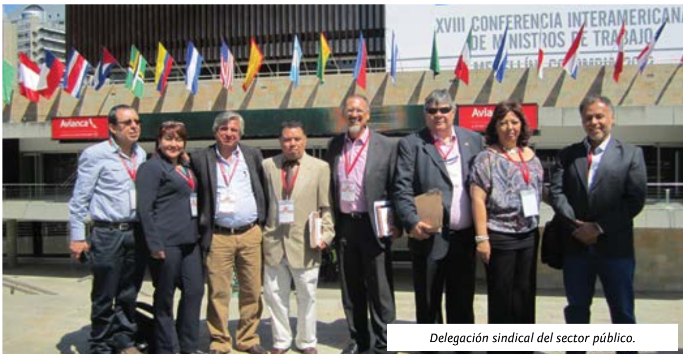
Delegación sindical del sector público.

El trabajo infantil es un flagelo potencialmente creciente en nuestros países. Ratificamos nuestro compromiso para su erradicación y denunciaremos en forma permanente los riesgos que enfrentan los niños y niñas, tales como, el trabajo doméstico sin pago, la prostitución y todo tipo de explotación de los menores.