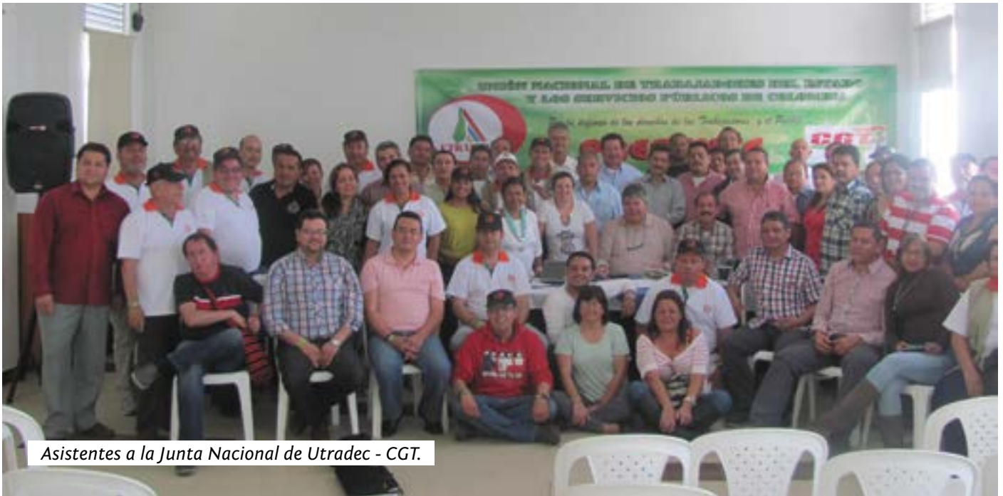
Asistentes a la Junta Nacional de Utradec - CGT.

E ntre el 7 y 9 de noviembre pasados, más de 80 participantes estuvieron en el cierre de actividades de 2013 y planeación de 2014. Se trata del primer encuentro luego de la elección en el pasado Congreso Nacional.