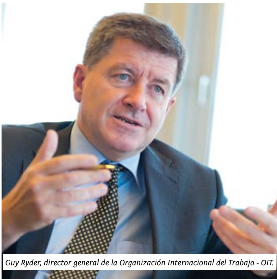
Guy Ryder, director general de la Organización Internacional del Trabajo - OIT.

“Gracias a nuestra experiencia en materia de empleo, estamos preparados para apoyar a los mandantes de la OIT de Francia y de otros países a fin de identificar maneras innovadoras, así como políticas, que han demostrado su eficacia en la reducción del desempleo, en particular del desempleo juvenil. Un crecimiento impulsado por el empleo es sin duda necesario.”