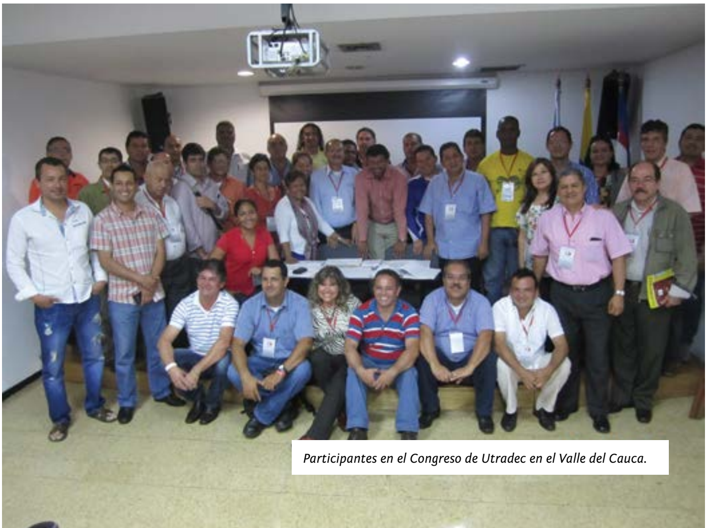
Participantes en el Congreso de Utradec en el Valle del Cauca.