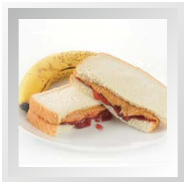
Un plato de comida

¡Conoce, aprovecha y defiende tu caja: patrimonio de bienestar para tu familia y el país!