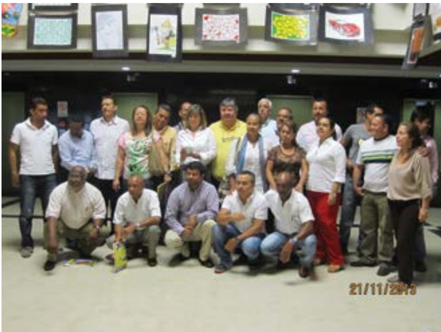
Participantes del Seminario de Sintepumcali.