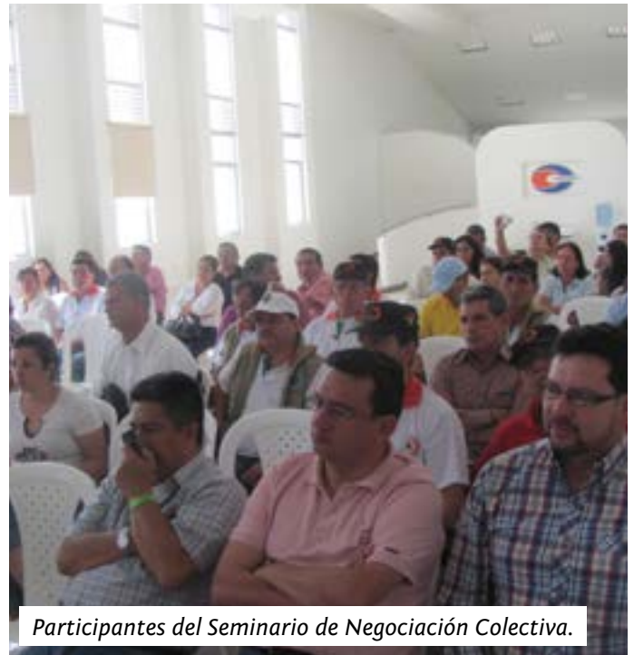
Participantes del Seminario de Negociación Colectiva.