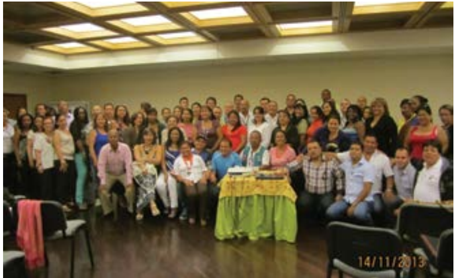
Asistentes al Seminario de Sindimunicipios.

Preparándose para la negociación unificada de 2014 y sosteniendo que la formación sindical es exitosa para la acción, el 13 y 14 de noviembre pasados, con la participación de más de 180 trabajadores, se cumplió con éxito el Seminario que concluyó con una asamblea que autorizó avanzar en la unificación de un pliego entre Sindimunicipios, Sinempublic y Sintepumcali.