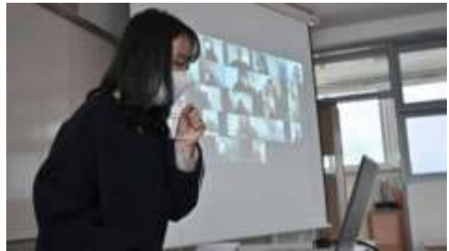
“Corea del Sur está combatiendo la pandemia con tecnología”.

El suelo se había mantenido intacto hasta que empezamos a excavar los cimientos de la tierra para transformarlo en gas, petróleo y carbón. Y pensábamos que la Tierra permanecería allí siempre, intacta.