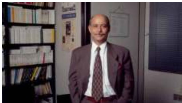
El sociólogo Jeremy Rifkin defiende que nos estamos moviendo hacia la Tercera Revolución Industrial.

El cambio climático va a estar con nosotros por miles y miles de años; la pregunta es: ¿podemos nosotros, como especie, ser resilientes y adaptarnos a ambientes totalmente distintos y que nuestros compañeros en la tierra puedan tener también la oportunidad de adaptarse?