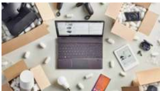
“El internet de las cosas reconfigurará la forma en que se gestiona toda la actividad en el siglo XXI”.

En un periodo como el que vivimos, las tecnologías nos permiten integrar a un gran número de personas en un nuevo marco de relaciones económicas.