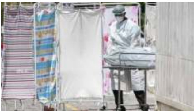
“La pandemia es una llamada de alerta en todo el planeta”.

Y sí, tenemos que emprender la revolución hacia el Green New Deal global, un modelo digital de cero emisiones; tenemos que desarrollar nuevas actividades, crear nuevos empleos, para reducir el riesgo de nuevos desastres.